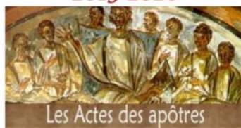
Les Actes des apôtres